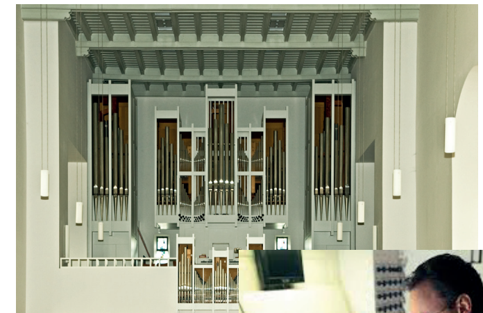
Orgel der Kirche St. Georg